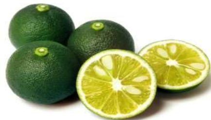
ハウスすだち 1kg入り1箱